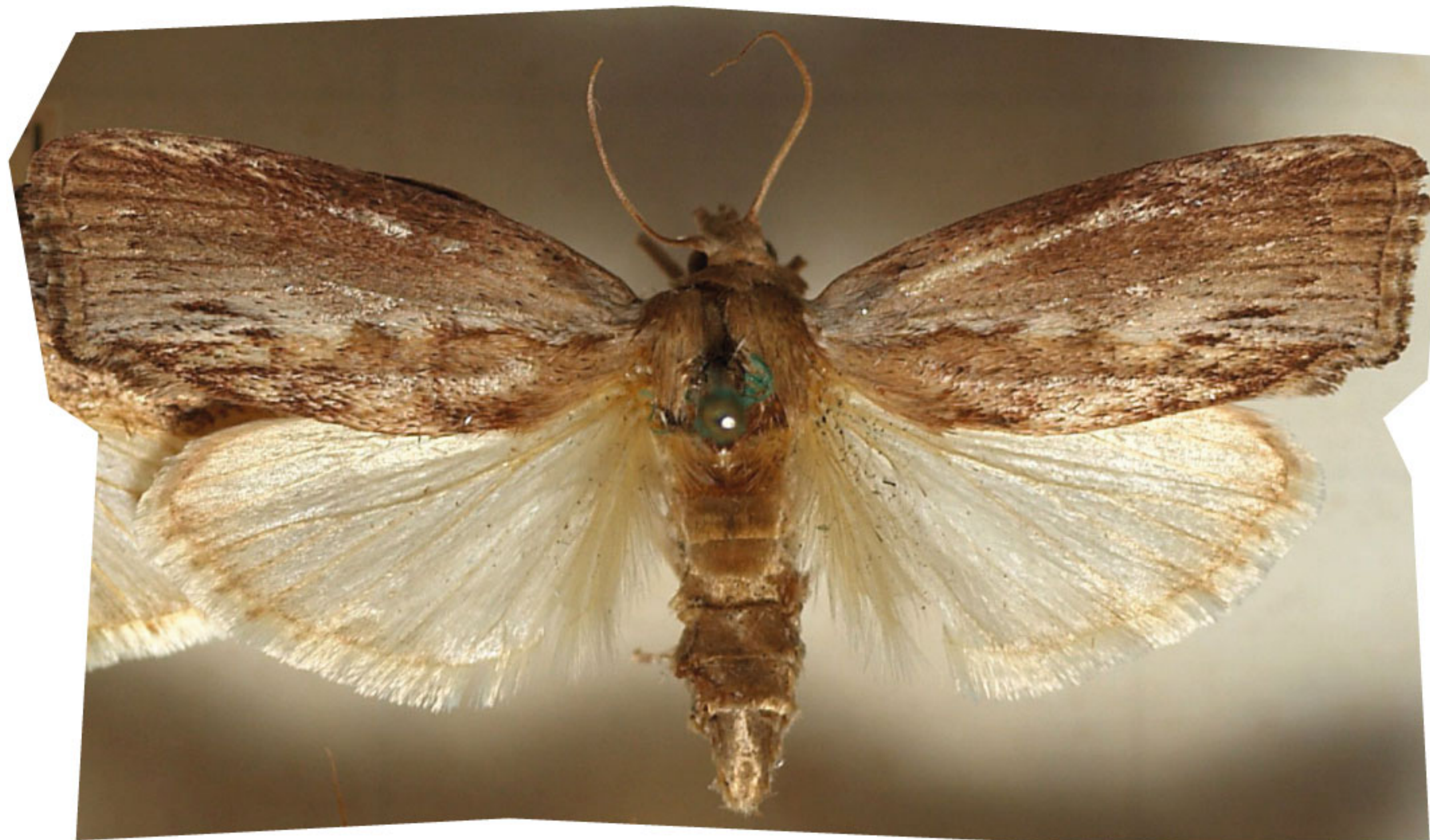
motyl barciak większy

Niedawno naukowcy odkryli, że ze wszystkich zwierząt najlepszy słuch ma najprawdopodobniej jeden z motyli. Nazywa się on barciak większy ( Galleria mellonella ). Jego słuch jest nawet lepszy niż delfinów i nietoperzy, które do niedawna uchodziły za ekspertów w tej dziedzinie.